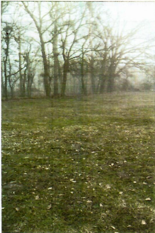
Fot. Stan istniejący terenu

Dojazd na teren działki jest zapewniony od strony ul. Lipowej. Lokalizacja boiska zapewnia bezpieczny i łatwy dojazd do obiektu.